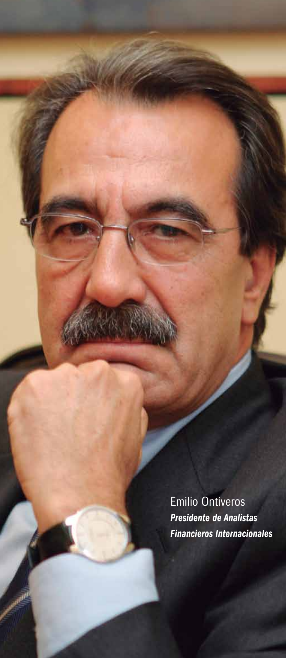
Emilio Ontiveros Presidente de Analistas Financieros Internacionales

necesita mejorar el capital humano porque es la forma de capital más determinante a la hora de que las economías compitan internacionalmente. Todo lo que sea erosionar los recursos a la educación dificulta la disposición de un capital humano de primera categoría.